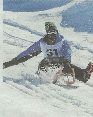
Afrikanische Rodelmeisterschaften , am 26.1.

WAGRAIN-KLEINARL. „Cool Runnings in Kleinarl“ Am 26. Jänner wird in Kleinarl „die coolste Integrationsveranstaltung der Welt“ ausgetragen: Zum zweiten Mal finden die Afrikanischen Rodelmeisterschaften unterhalb der Kleinarler Hütte statt. Fast wie im Kinofilm Cool Runnings, nur eben in echt und in Kleinarl.