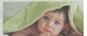
Geburten des Klinikum Schwarzach 2019.