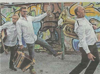
Neue Energie tanken mit dem