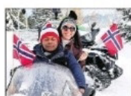
FAVNER ALLE: Sport spricht alle Sprachen er en organisasjon hvor språk og kultur er underleggen samhold og mangfold.

- Her var folk fra 20 ulike nasjoner og alle snakket sammen